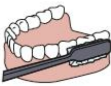
4. Außenseite unten/ Scheibenwischer