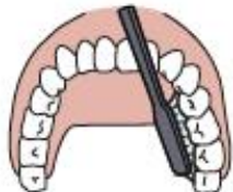
5. Innenseite oben/ Scheibenwischer