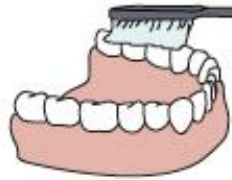
2. Kauflächen unten