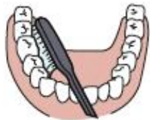
3. Innenseite unten/ Scheibenwischer