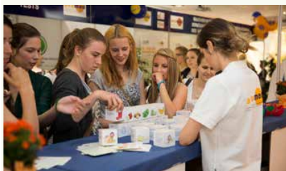
Schülerinnen bauen eine Ernährungspyramide auf

„Bruno Vitamini“ wurde auch 2017 fortgesetzt. In 35 Kindergärten konnten 452 Unterrichtseinheiten mit 3.620 TeilnehmerInnen betreut werden. Im Modul „Genussvoll Essen und Trinken“ wurden 180 Institutionen mit insgesamt 717 Unterrichtseinheiten betreut. Im „DidA“ wurden im Lauf des Jahres 887 Beratungsgespräche zu unterschiedlichen Ernährungsthemen durchgeführt. 4 „Teen Power“-Kurse sowie ein „Natürlich abnehmen“-Kurs für Erwachsene waren wieder Teil des avomed -Angebots.