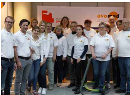
Das avomed -Team